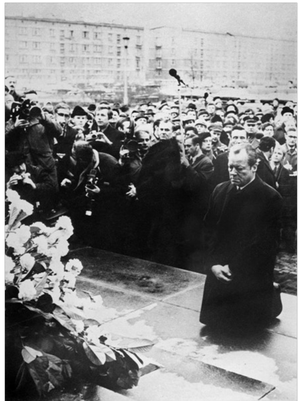
德聯邦總理勃蘭特，華沙猶太人殉難者 紀念碑前下跪請罪

所有華人希望這一舉動能觸動日本開始比照德國對於二戰侵略與大屠殺的處理模式，並誓言永遠摒棄日本軍國主義。