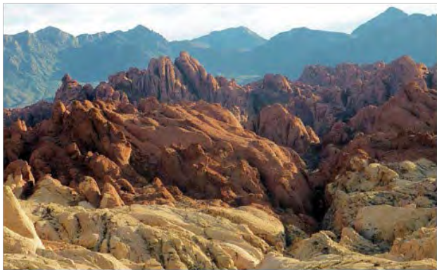
Fire Wave Trail in the Valley of Fire State Park