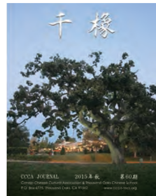
Cover photo taken by Muren Chu 朱牧仁