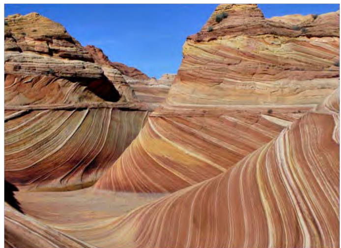
The Wave(在 Utah 與 Arizona 的交界)

登山健行成為我們的嗜好是因為貪看美景之故。北美被開發得晚，吸睛的原始大自然雖無處不在，可多數得靠兩條腿走去才欣賞得到。此外，這兒的國家公園也提供無數維修良好的步道系統，引導你去看開車無法接近的美景。這些都是推動我們健行的初始動力，跟有人健行是為了運動健身不太一樣。北美是個健行者的天堂，我們逮住機會就東奔西跑，二十多年來成果斐然，目擊了不少千嬌百媚的山水，還得到體力增強的附加價值。在此我希望大家不要被上面的陳述嚇着，只要有適當的心理準備，登山健行絕對是個安全又美妙無比的休閒活動。