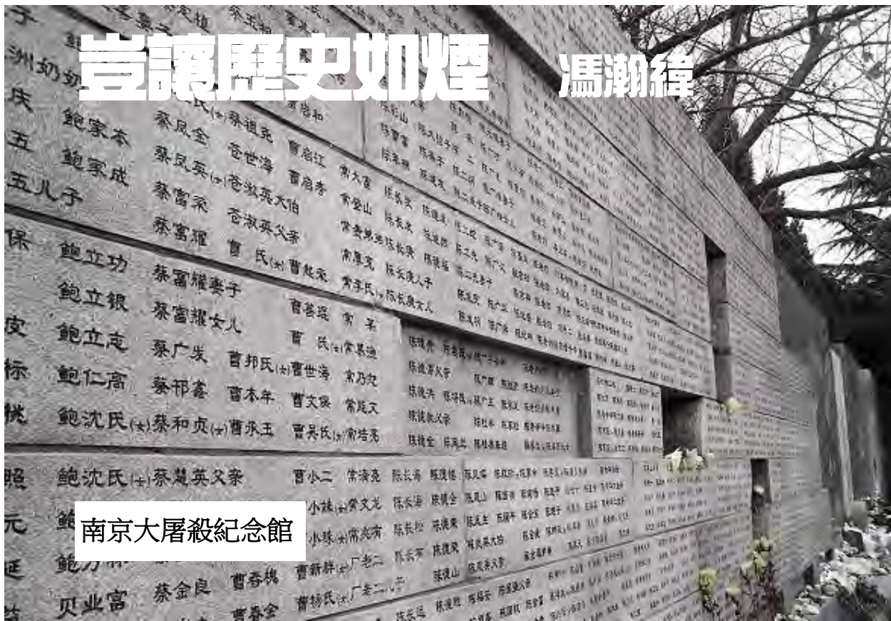
南京大屠殺紀念館