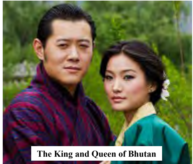
The King and Queen of Bhutan

再回到帕羅的重頭戲就是參觀虎穴寺，它是不丹最神聖的佛教寺廟，是全球佛教徒最重要的朝聖地之一，更是旅遊者不容錯過的景點。虎穴寺建在九百公尺高的懸崖峭壁上，已有三百多年的歷史。要走那麼高的原始山路，我曾經一度想放棄，在同伴們相互鼓勵之下決定半程騎馬半程徒步；一路上滿眼青蔥樹林，遠眺遠方山頂白雪，倒也不覺得辛苦，兩個多小時終於到達目的地。相傳蓮花生大師（藏傳佛教的祖師）騎著老虎飛過此地，就在一洞穴中修行三年，並且收服了佔據山頭的山神鬼怪，於是後人於此地建寺以為紀念。寺內有好幾個殿堂，四周掛著唐卡，香煙裊繞；一扇要弓身蹲下才能進入的小門就是虎穴的入口，門框上寫著‘tiger nest’進入之後還要走過一根橫跨兩邊石壁，十分陳舊不到一尺寬的木條，底下是相當深的石溝，我又要打退堂鼓了，但是後面在狹縫中排隊的人群不允許我後退，於是同伴們彼此接應，一推一拉之下居然也