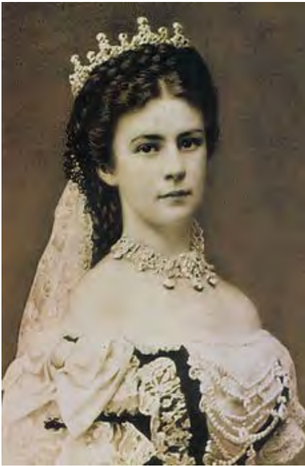
Photograph of Empress Elisabeth of Austria (1837–1898), the day of her coronation as Queen of Hungary

我們坐了十幾小時的德航先到法蘭克福，再轉機到匈牙利的布達佩斯。下機拿了行李出關後，便見到了我們的導遊莎莉女士，給人印