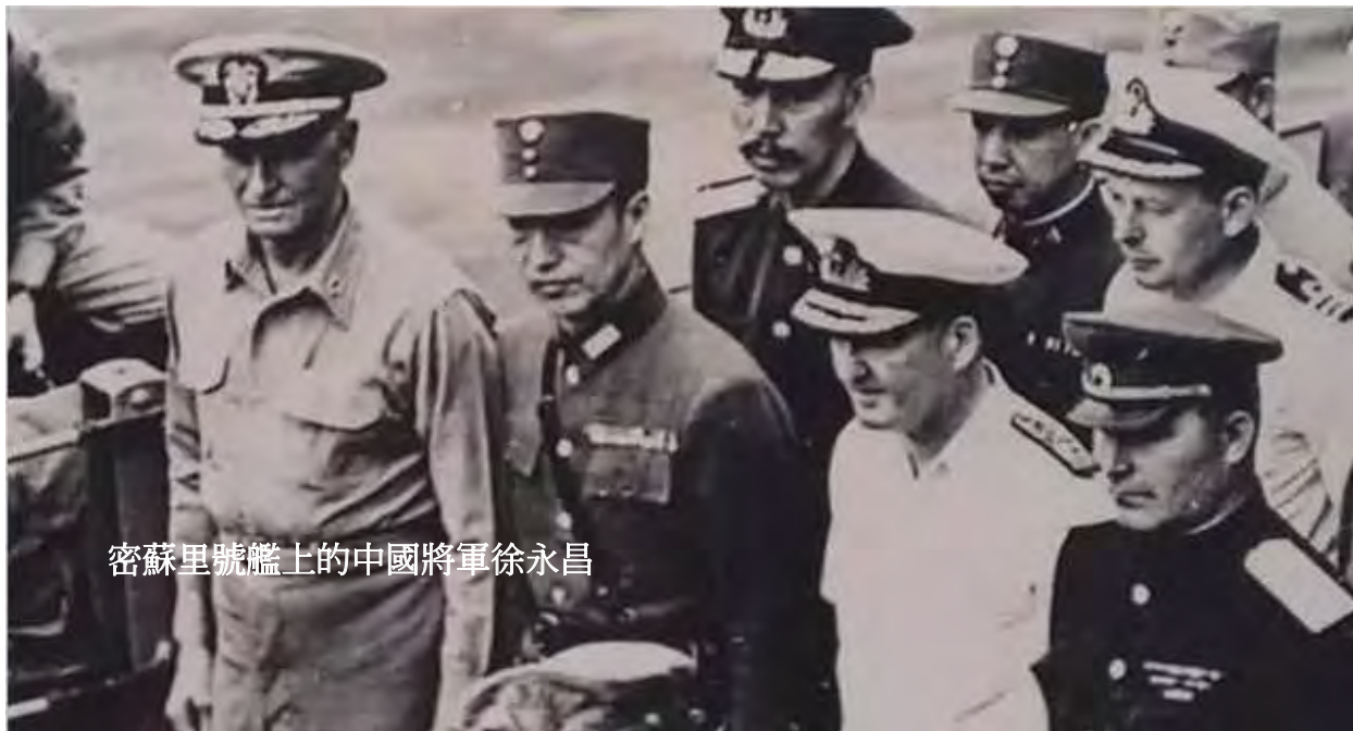
密蘇里號艦上的中國將軍徐永昌