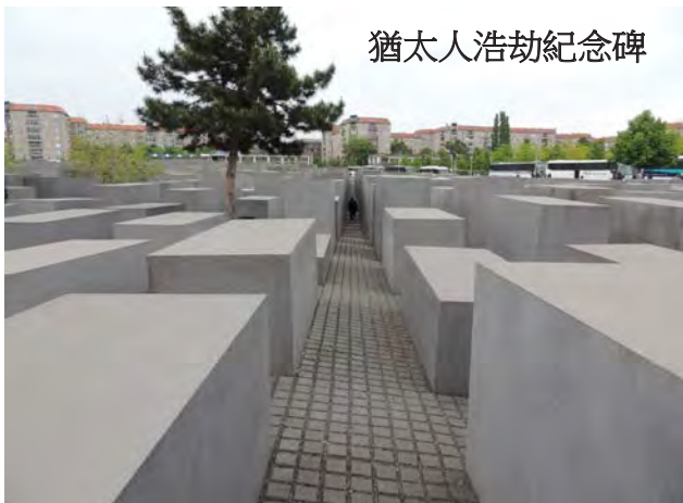
猶太人浩劫紀念碑

日本政府在廣島與長崎的兩個館裡頭，只片面地譴責原子彈的殘酷，卻從來沒有一個字探討誰是戰爭的罪魁禍首，也沒有一句懺悔的話。日本是以戰爭受害者觀點來看廣島和長崎的原爆，更強調日本是世界唯一受核能攻擊的受害國。明治大學現代日本史教授山田朗說：「日本對戰爭的記憶早已變成受害人。日本是犯罪者的記憶早被抹去。」