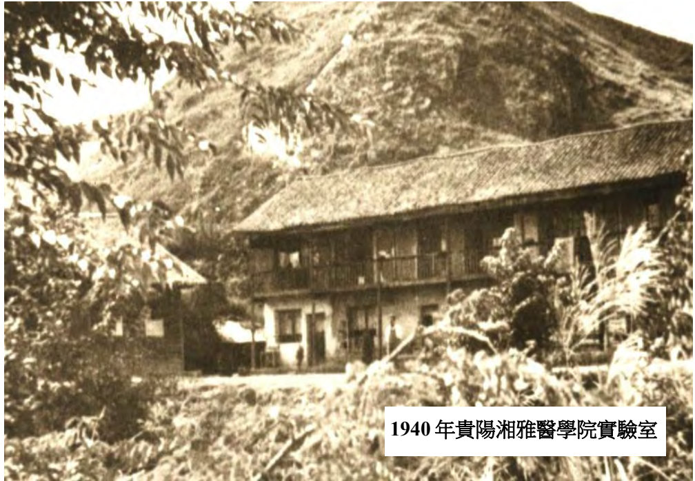
1940年貴陽湘雅醫學院實驗室

經過千辛萬苦的長途跋涉，終於走到貴州了。姐姐去遵義讀浙江大學教育系，我留在貴陽開始讀湘雅醫學院一年級，成了一位公費生。