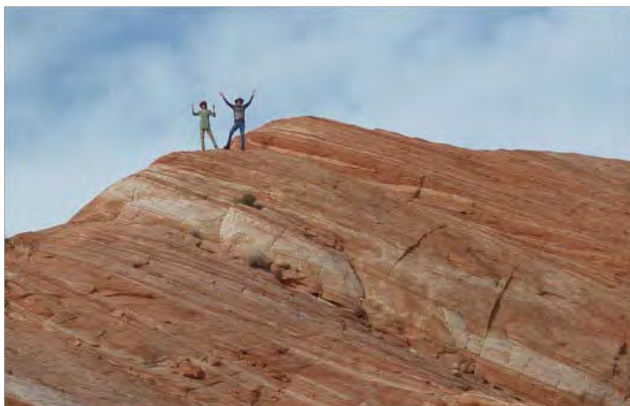
Fire Canyon Road in the Valley of Fire State Park