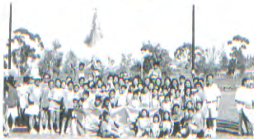
南加州華美運動會 代表千禧中文學校多開心