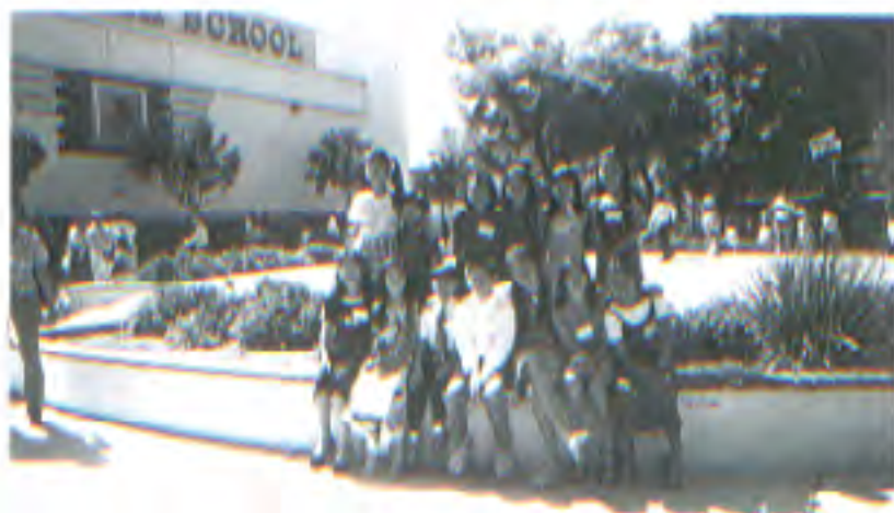
演講、詩詞朗誦比賽隊友合影