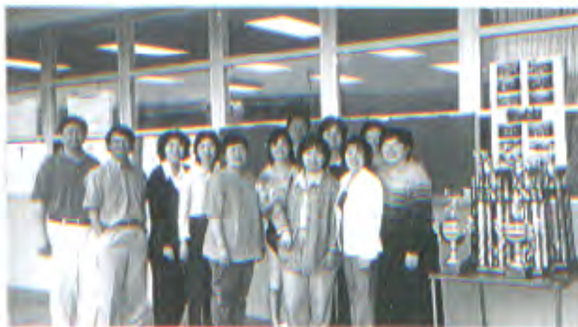
千禧中文學校 2000-2001 學年度教職員