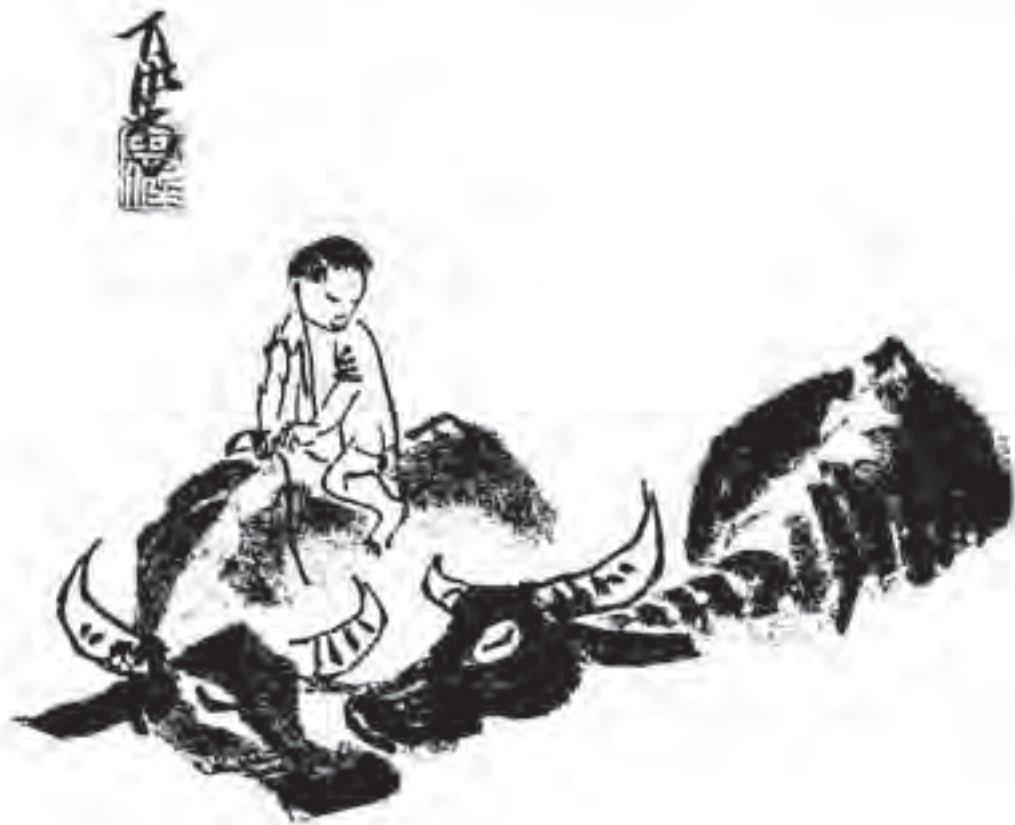
七八 牧童騎牛過河 李可染畫 Fording the Stream