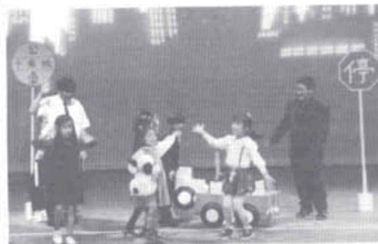
The younger students of TOCS wish for peace to come with the new year as they perform their skit about a "Peace Machine."