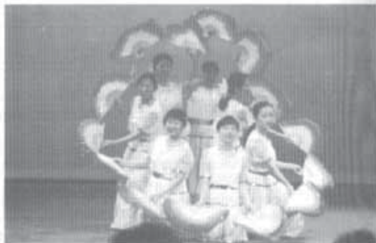
The AMGEN Dance Troupe is comprised of adults who choreograph and perform ancient cultural dances.