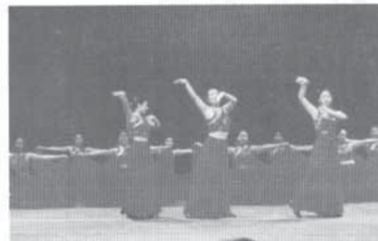
The advanced group of the Peony Dance Ensemble elegantly perform a traditional Mongolian dance.