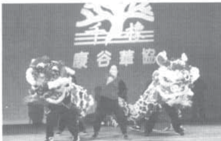
Lion dancing is a traditional way of celebrating the New Year in many Asian countries. The Chinese school students imitate this traditional dance to welcome the Year of the Tiger.