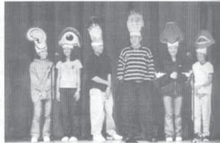
The Reading and Writing class of TOCS perform a humorous and comical skit as the New Year arrives.